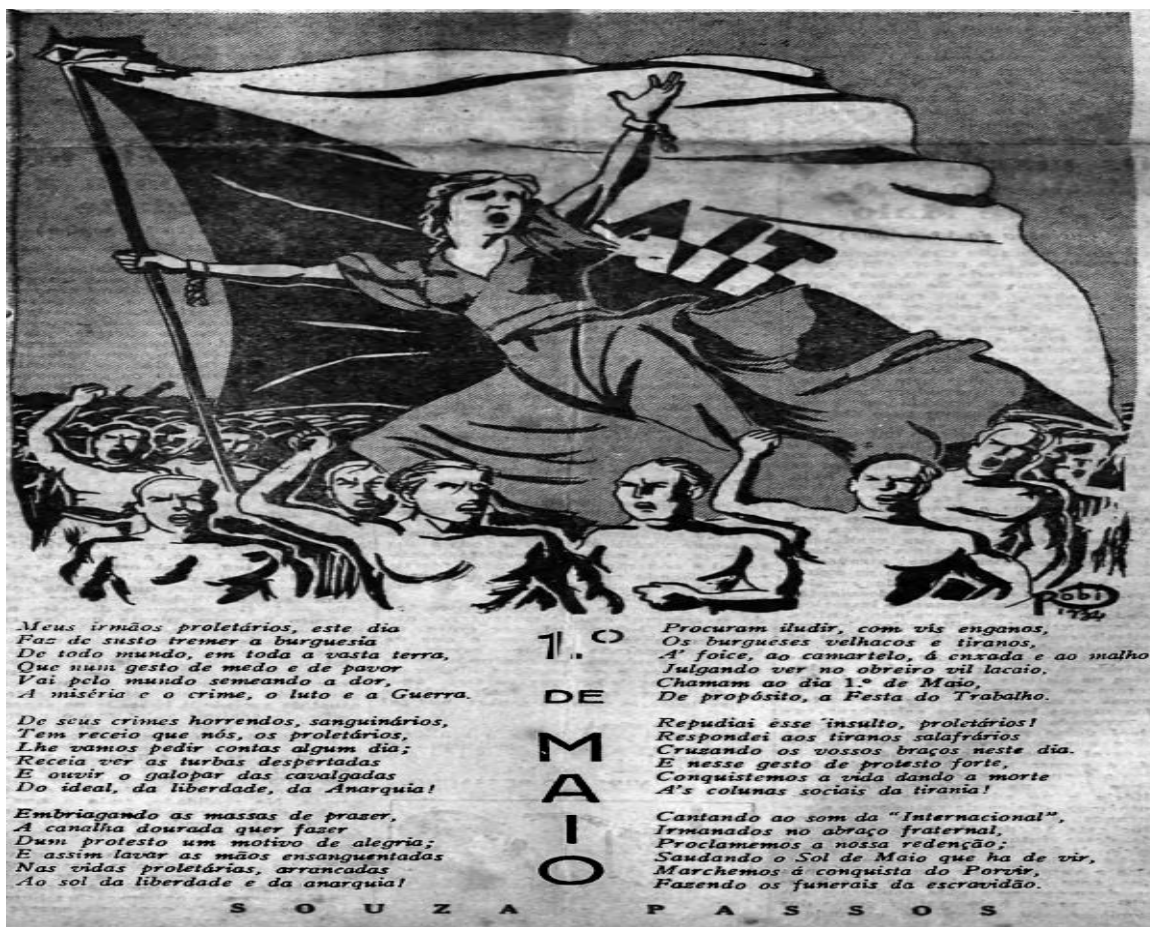
Imagem 02: A Plebe: 28/04/1934, p.01.