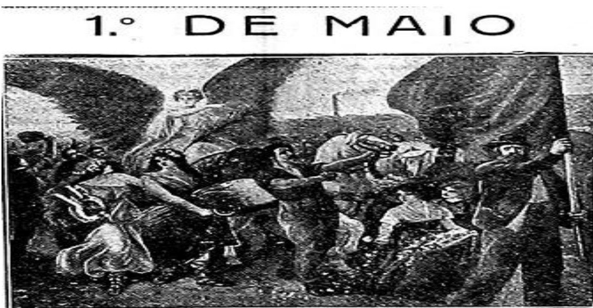
Imagem 03: A Lanterna , 19 de abril de 1934, p.04.

Como mostramos, todas essas imagens foram retiradas do jornal A Plebe . Já em A Lanterna , não encontramos imagens com bandeiras rubro-negras, mas sim com uma bandeira de cor única. Em 19 de abril de 1934, por exemplo, os redatores do jornal utilizaram a imagem de um homem de cartola e terno carregando uma bandeira de uma só cor. Ele guia homens e mulheres durante as celebrações do Primeiro de Maio. Acima da multidão está um anjo, apontando o caminho a ser seguido. O anjo, nesse caso, ele não representa um símbolo religioso, mas o ideal anarquista que indica os rumos corretos para emancipação humana.