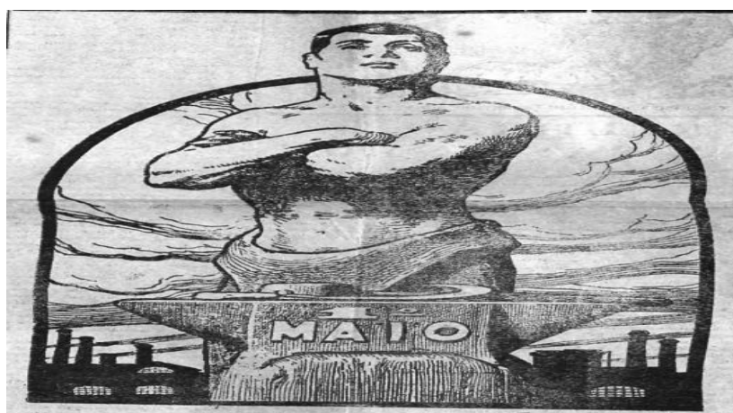
Imagem 04: A Plebe , 29/04/1933, p.06.

Ainda no que se refere às imagens sobre o Primeiro de Maio, além daquelas nas quais aparecem bandeiras, outros tipos também foram usados. Em A Plebe , na edição de 29 de abril de 1933, os redatores se valeram de uma em que aparece um homem robusto com os braços cruzados, representando a força dos trabalhadores em greve nesse dia de luta e luto; ao fundo aparecem as fábricas paralisadas. À frente desse homem aparece uma bigorna na qual está escrito “1º de Maio”; em cima dela encontram-se um martelo e uma foice, não representando o símbolo do Partido Comunista, mais sim os instrumentos de produção utilizados pelos trabalhadores do campo e da cidade.