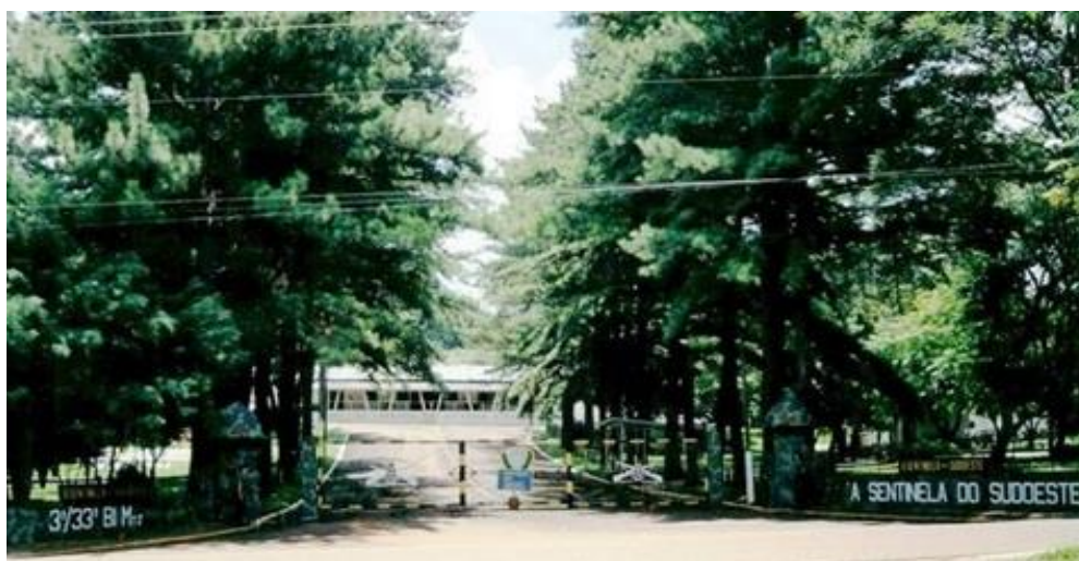
Figura 6. Portão principal do quartel de Francisco Beltrão/PR na década de 1990 com sua denominação histórica.

Francisco Beltrão, o grupo guerrilheiro realizou uma emboscada 15 . E que este combate armado produziu uma vítima fatal que mais tarde se transformaria em herói da Ditadura Militar: o 3º Sargento Carlos Argemiro de Camargo. Camargo foi alvejado várias vezes ao desembarcar da viatura quando realizou contato com o grupo de Cardim. (AUGUSTO, 2002) Entretanto, estudos recentes apontam que a situação pouco esclarecida da morte de Camargo pode ter encoberto algo inadmissível para os militares em tempos de repressão, a incompetência militar em combate. Há indícios de que o herói pode ter sido morto pelas armas dos próprios companheiros de pelotão durante o confronto armado, a “tese do tiro amigo”. (ZATTA, 2013) 16