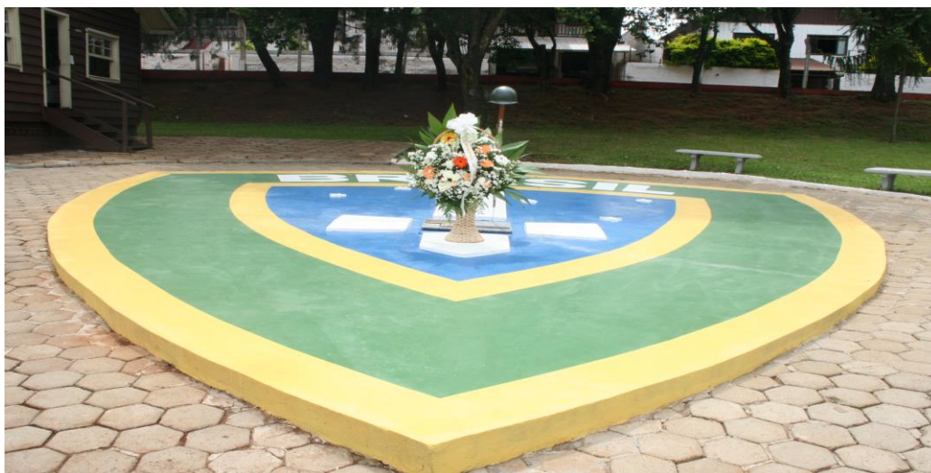
Figura 7. Aspectos da Praça Tenente Camargo, abaixo do brasão militar encontra-se sepultados os restos mortais do herói militar. Aos fundos à esquerda, a porta do Museu Militar Tenente Camargo.

Neste contexto foi instituído o culto cívico à Camargo, além de formaturas e cerimoniais militares orientados por devocionais católicos. Seguiu-se nas décadas finais do século XX a edificação de “lugares de memórias” como cenotáfio, monumentos, praça, rua, colégios, lápide, epitáfio e casa museu militar, amparando uma das mais elaboradas construções simbólicas da Ditadura Militar. (ZATTA; COSTA GAMA; RIPPEL, 2010)