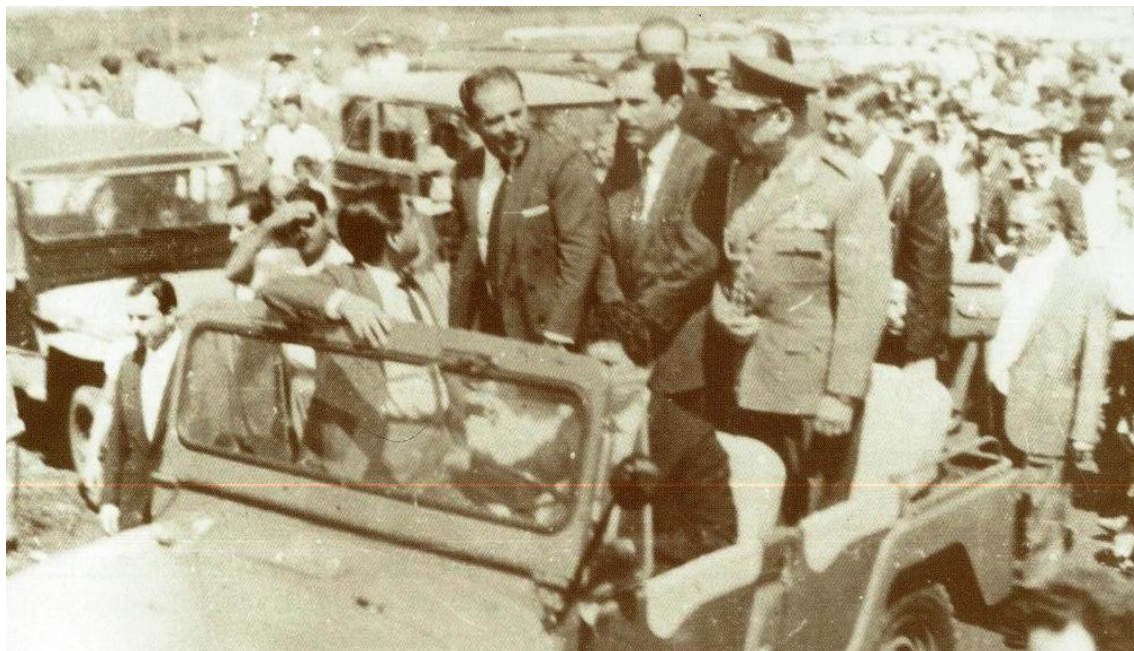
Figura 4. Visita ao sudoeste do Paraná em 17 Mar. 1962 do Presidente da República João Goulart (esquerda da foto), ladeado pelo Governador Ney Braga e o General Aurélio de Lyra Tavares - Praça Presidente Vargas/Pato Branco-PR. A visita marcou a abertura do processo de legalização das terras. Fonte: Revista 50 anos da Revolta dos Posseiros 1957-2007: Resgatar o passado de lutas, para valorizar a liberdade do presente . Departamento de Cultura do Município de Pato Branco - PR.

presidencial, a garantia da propriedade da terra, transformando incertos posseiros em proprietários legais.