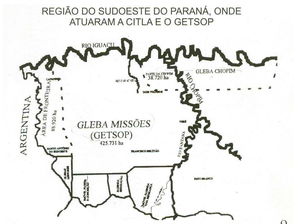
Figura 1. Mapa da Gleba Missões e Chopim. Fonte: Caderno Cultural nº 1 Projeto Memória intitulado Revolta dos Posseiros: Cinquentenário 1957-2007.