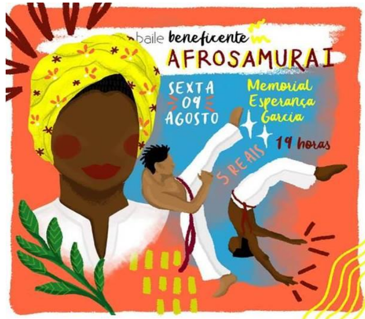
Figura 03: Cartaz do evento beneficente realizado no Memorial Esperança Garcia em Teresina.