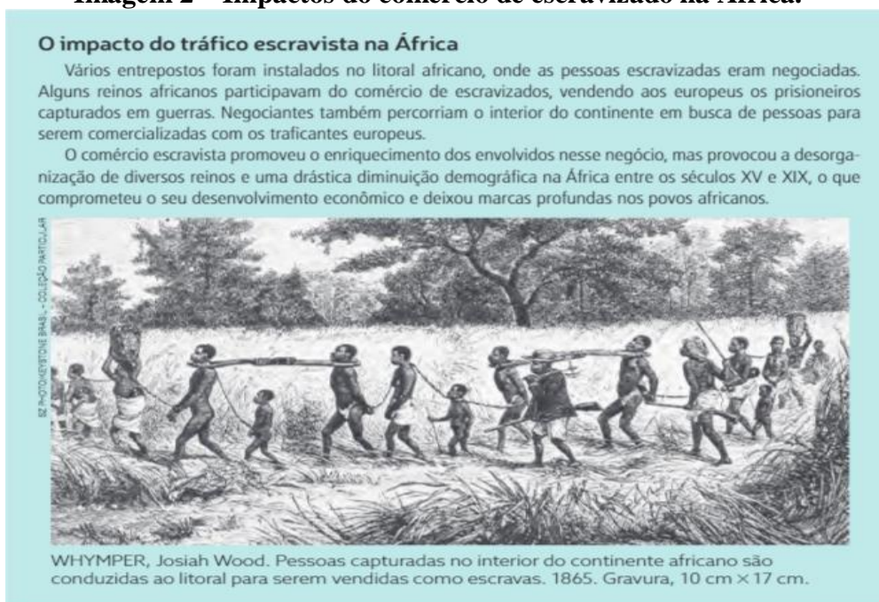
Imagem 2 – Impactos do comércio de escravizado na África.